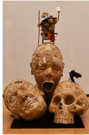
安田 正裕 《邯鄲の夢》