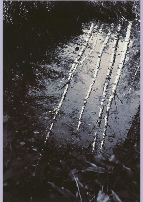
安井仲治（白樺） 1935年 個人蔵（寄託）

協賛：公益財団法人伊藤文化財団、ワフフタワワ神戸（株式会社ハーフ・メンバー・ロード）、兵庫県立美術館「芸術の館友の会」