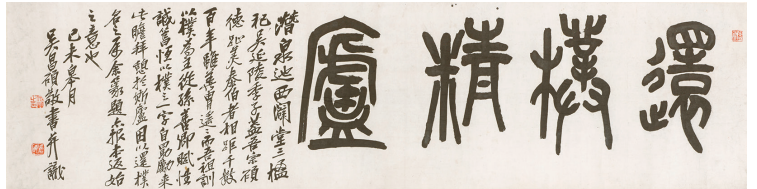
呉昌碩《篆書還構精廬横披》1919年 兵庫県立美術館蔵(梅舒適コレクション)