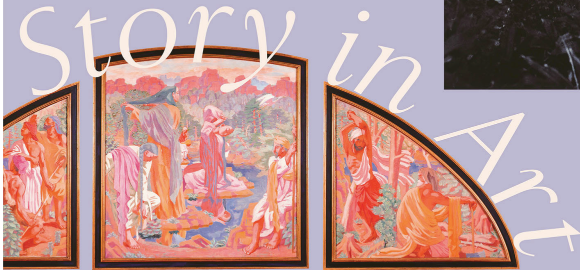
和田三造 《朝鮮総督府慰問画稿（三幅対）》（部分） 1926年頃 公益財団法人伊藤文化財団寄贈