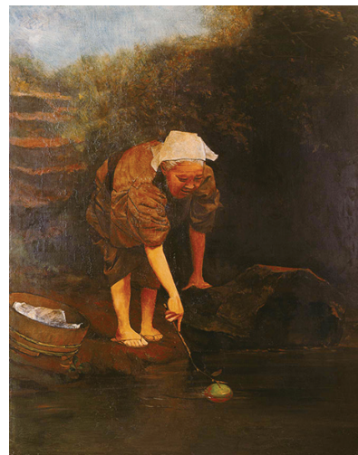
神中糸子《桃太郎》兵庫県立美術館蔵