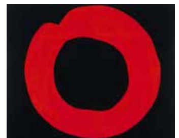
図2 吉原治良《黒地に赤い円》1965年 兵庫県立美術館