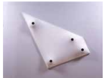
図7 今井祝雄 《白のセレモニー・HOLES#6》 1966年 兵庫県立美術館

【出品作家】今井祝雄、小野田實、喜谷繁暉、木梨アイネ、田井智、高崎元尚、田中竜児、坪内晃幸、堀尾貞治、松田豊