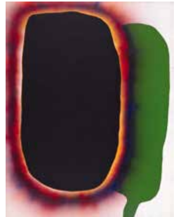
図6 元永定正《作品 N.Y. No.1》1967年 兵庫県立美術館