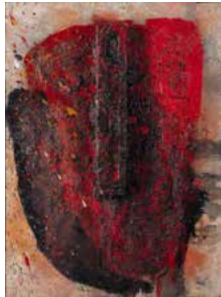
図5 嶋本昭三《作品》1961年 兵庫県立美術館(山村コレクション) © shimamotoLAB Inc.

【出品作家】上前智祐、浮田要三、金山明、嶋本昭三、白髪一雄、鷺見康夫、前川強、松谷武判、正延正俊、向井修二、村上三郎、元永定正、吉原通雄