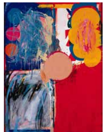
図4 山崎つる子《作品》1961年 兵庫県立美術館