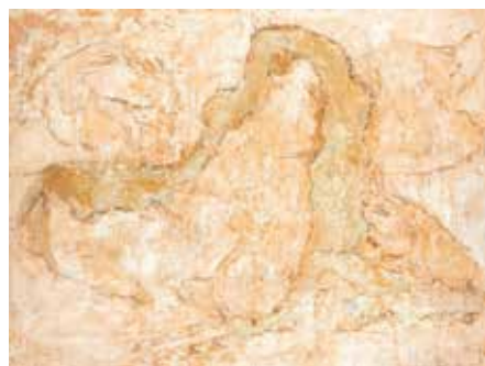
図3 白髪富士子《作品》1960年 兵庫県立美術館(山村コレクション)