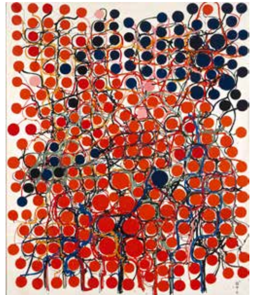
図1 田中敦子《作品》1958年 兵庫県立美術館(山村コレクション)