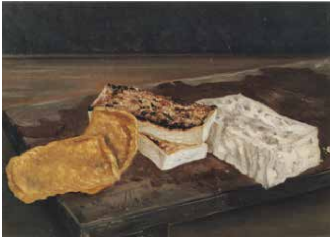
2) 高橋由一《豆腐》1877年 油彩・キャンパス 金刀比羅宮蔵

調査・研究によって再評価された作品、新たに発見され作家の評価に再考を促した作品、めぐる時間の中で変らぬ魅力を発し続ける作品などを中心に展示し、明治中頃から明治末・大正初頭までの意外に幅広い作品を紹介します。