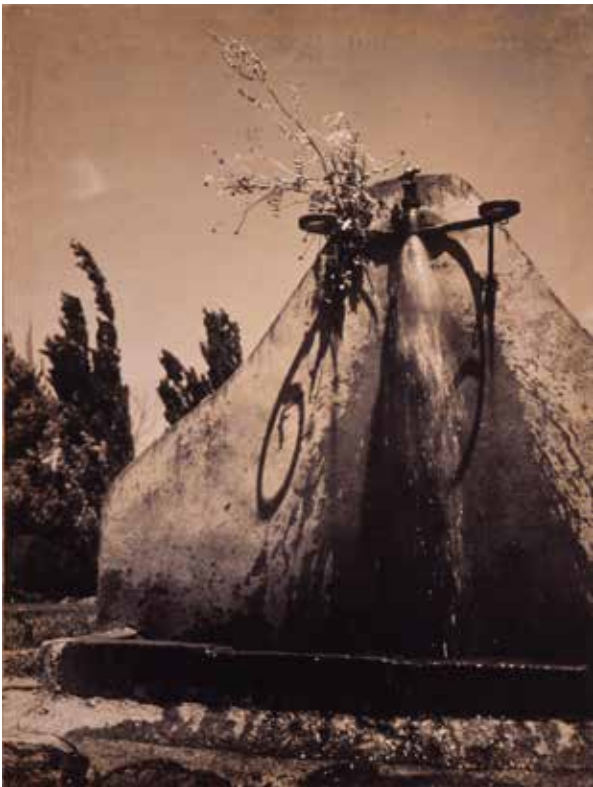
7) 安井仲治《公園》1936年 ゼラチンシルバープ リント・紙