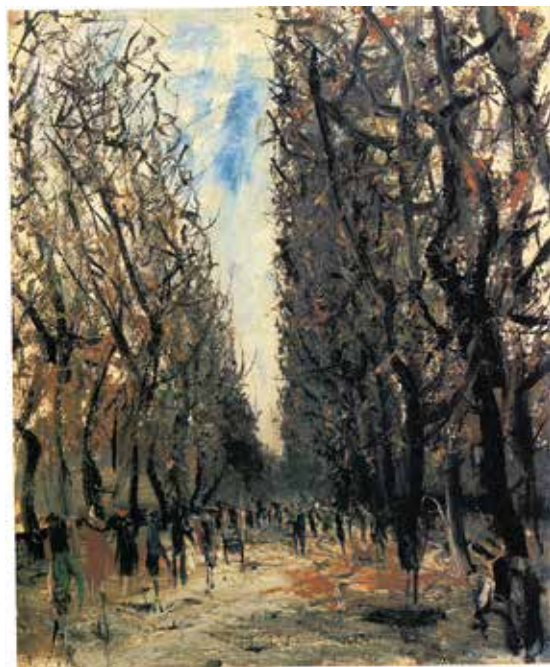
5) 佐伯祐三《リュクサンブール公園》1927年 油彩・キャンバス 田辺市立美術館蔵