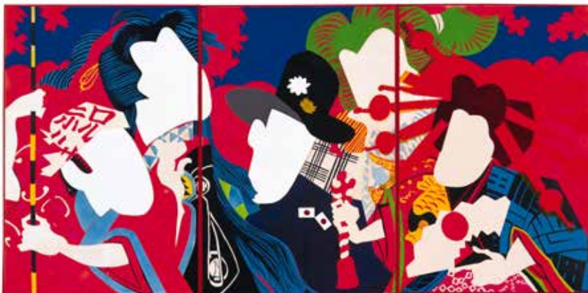
9) 篠原有司男《女の祭》1966年 蛍光塗料、油彩、プラスチック・板 兵庫県立美術館蔵