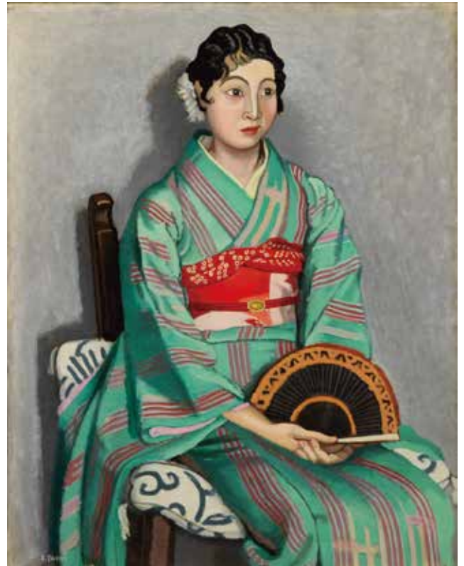
6) 安井曾太郎《座像》1929年 油彩・キャンバス 個人蔵

キレイな若い女の人が美しいキモノを着て行儀よく座っている。この絵を、そうした「ありがちな」絵の中の単なる一枚だと思っははいけません。この絵には、自身の様式（絵の描き方、といった意味です）をすみずみまで貫こうとする画家の執念がつまっています。試しに、頭の中でこの絵を8～10cm四方の碁盤の目に区画して、一区画ごとに順番に見ていけばよい。スゴイ集中力で隅から隅まで手を抜かず、描きに描いたことが分かるから。うーん、これ以上描けない、つまり終わるべきところで終わっている絵、ということでもあります。「そんな変な絵の見方をわざわざすることないではないか」というご意見はもったもですが、本作の数年前から始まる安井曾太郎の様式確立へ向けた精進ぶりは、常識的な絵の見方ではとてもとらえきれません。