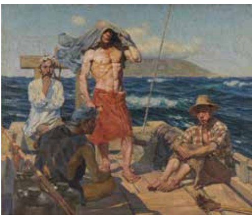
1) 和田三造《南風》1907年 油彩・キャンパス 東京国立近代美術館 重要文化財

兵庫県生野町（現朝来市）生まれの和田三造（1883-1967）が第1回文展に出品し、見事、最高賞を受賞した作品です。文展とは、文部省が主催してはじめての「官」の展覧会で、やはりそれなりの「権威」でした。三造、弱冠24歳、並みいる先輩画家をさしおいての受賞です。「人物の関係がよくわからない」「船と海がつながっていない」「風は本当に吹いているのか？」といういろいろ言う人もいたのですが、大勢の見方は「小さな欠点はあるが、これでいい。いや、むしろこれがよい」という方向に落ち着いたようです。おりしも、1904年に開戦した日露戦争での勝利の直後とあれば、世間は右肩上がりのイケイケムード。そうした雰囲気や作品を重ね合わせる人もいたことでしょう。というわけで、今や、注目度アップの三造《南風》、見逃す手はありません！