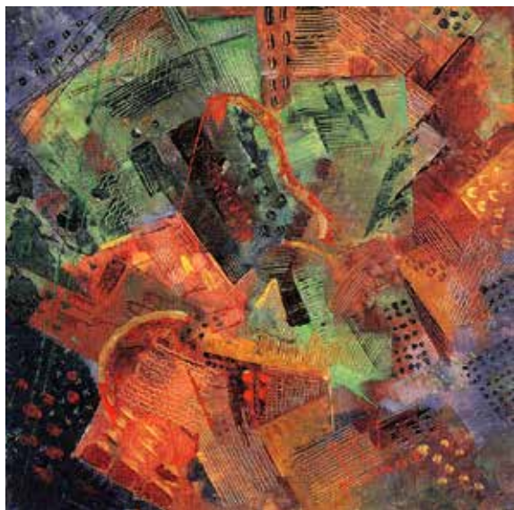
4) 柳瀬正夢《五月の朝と朝飯前の私》1923年 油彩・キャンバス 武蔵野美術大学 美術館・図書館 蔵

大正期を語る定番ともいえる個性派の作家の作品、1980年代中頃以降の研究で、存在感を増した新美芸術といわれる新しい傾向の作品を展示します。あわせて、確立しつつある芸術家像のもとに、作家と作品の関係が整理されていく様をうかがいます。