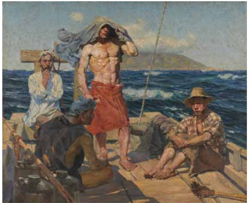
1) 和田三造《南風》1907年 油彩・キャンバス 東京国立近代美術館 重要文化財