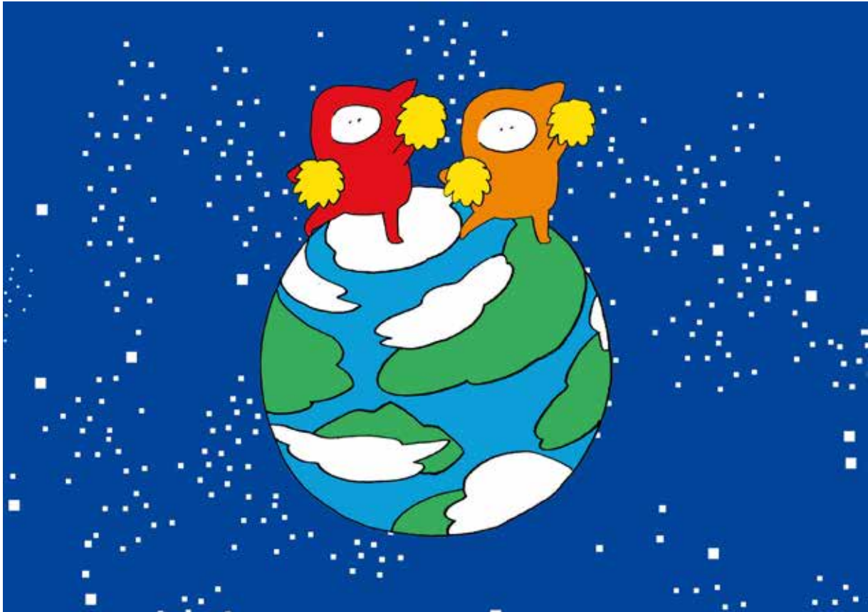
1. 「作家による作品イメージ」2016年