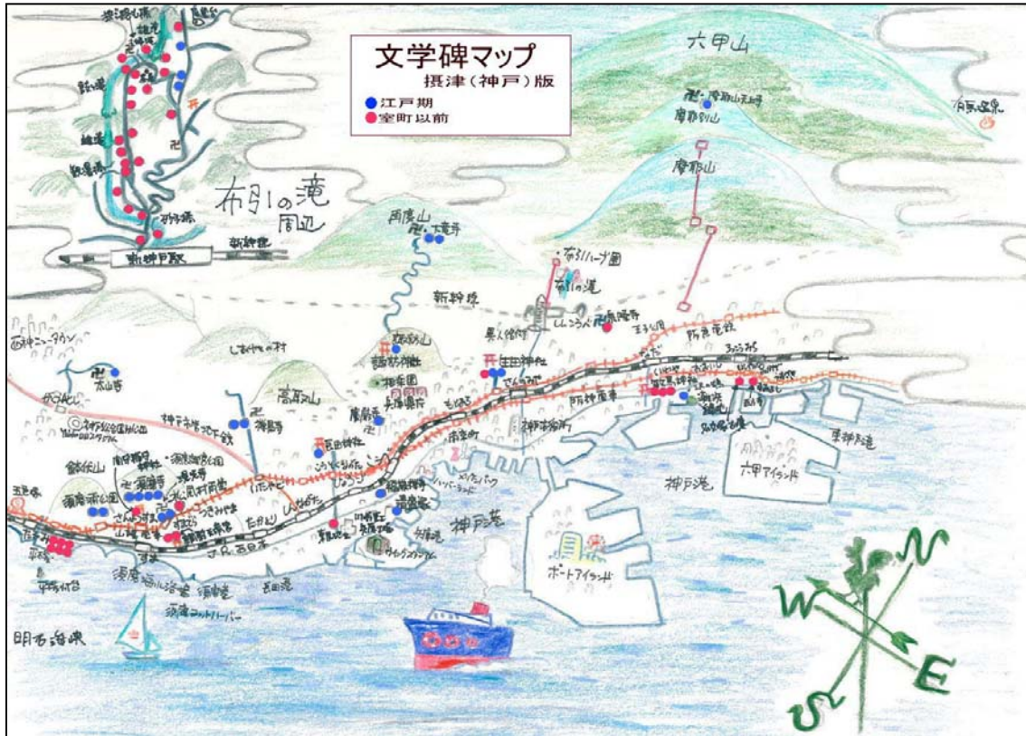
(新 文学碑マップ 神戸)