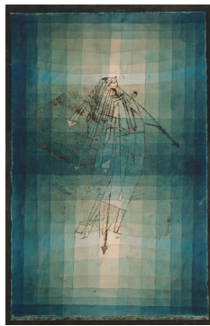
バウル・クレー《蛾の踊り》1923年 愛知県美術館蔵 Paul Klee, Dance of the Moth , 1923 Aichi Prefectural Museum of Art

バウル・クレー展 創造をめぐる星座 Paul Klee, Solitary and Solitary