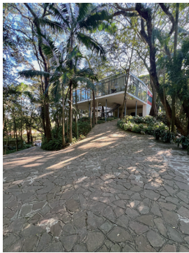
リナ・ボ・バルディ ガラスの家 1951年 Lina Bo Bardi, Casa de Vidro, 1951

リビング・モダニティ 住まいの実験 1920s－1970s LIVING Modernity: Experiments in the Exceptional and Everyday 1920s－1970s