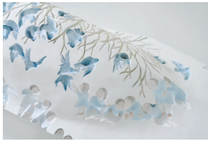
中谷ミチコ《デコボコの舟》(部分) 2022年 Nakatani Michiko, Boat of Presence and Absence , 2022

Form in Art – Perceiving with the Hand is a series of annual exhibitions that was launched in 1989. This edition, the 35th, centers on Nakatani Michiko (born in Tokyo in 1981), an artist who gained recognition for her unique reliefs in concave and convex are reversed.