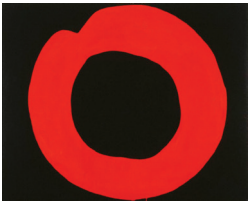
吉原治良《黒地に赤い円》1965年 当館蔵 Yoshihara Jiro, Red Circle on Black , 1965 Hyogo Prefectural Museum of Art

In conjunction with the EXPO2025 and the Setouchi Triennale 2025, and as part of the Setouchi Art Museum Link, this exhibition highlights masterpieces from the museum collection as well as important works acquired during the last fiscal year that are being shown for the first time.