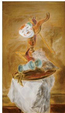
左: 中山岩太 《藤田ポートレイト》1926-27年 中山岩太の会蔵 left: Nakayama Iwata Portrait of Foujita, 1926-27 The Nakayama Iwata Foundation 右: 国吉康雄 《逆さのテーブルとマスク》1940年 福武コレクション right: Kuniyoshi Yasuo Upside Down Table and Mask, 1940 Fukutake Collection

20世紀前半の激動の時代、海外で成功と挫折を経験した二人の日本人画家、藤田嗣治（1886－1968）と国吉康雄（1889－1953）の展覧会を開催します。それぞれフランスとアメリカに渡った二人は、その地で画家としての地位を確立しました。パリとニューヨークで交流したことも知られていますが、太平洋戦争で大きくその立場が隔たることとなった二人の作品を画期となる時代ごとに展示します。