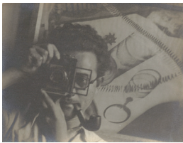
中山岩太《セルフポートレイト》1930年 中山岩太の会蔵 Nakayama Iwata, Self Portrait , 1930 The Nakayama Iwata Foundation

This exhibition focuses on Nakayama Iwata, one of the most accomplished Japanese photographers of the modern era. Born in Yanagawa, Fukuoka Prefecture, Nakayama moved to the U.S. after studying at the Tokyo School of Fine Arts. He established his own studio in New York and was also active in Paris until returning to Japan in 1927. He subsequently emerged as a leader of the Shinko Shashin (New Photography) movement while living in Ashiya, Hyogo Prefecture. Designed to commemorate the 130th anniversary of Nakayama's birth, this exhibition, presented in three parts, provides a comprehensive overview of the artist's work.