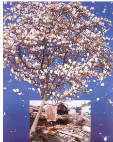
福田美蘭《淡路島北淡町のハクモクレン》2004年 当館蔵 Fukuda Miran Yulan in Hokudan-cho, Awajishima , 2004 Hyogo Prefectural Museum of Art

This exhibition, held in conjunction with 1995 ⇄ 2025: Our Lives from January 17, 1995 , takes a look back at the museum's collection activities over the past more than three decades, dating to the founding of the Hyogo Prefectural Museum of Modern Art in 1970. As part of a project to commemorate the Great Hanshin-Awaji Earthquake, the exhibition focuses on quake-related works as well as efforts to rescue and restore art.