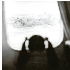
米田知子《震源地、淡路島》1995年 国立国際美術館蔵 Yoneda Tomoko, Looking at the epicenter, Awaji Island , 1995 The National Museum of Art, Osaka

30 Years on from the Great Hanshin-Awaji Earthquake 1995 ⇄ 2025 Our Lives from January 17, 1995