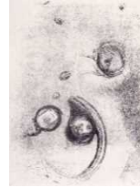
ルドン、オディロン《そして顔のない目が軟体動物のように浮んで……》1896年

ルドンの版画がモデルです。不思議で少し不気味なたちから、目玉のトカゲが生まれました。あれは目なのか口なのか!?