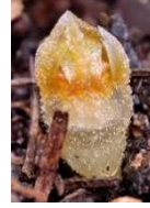
「コウベタヌキノシヨクダイ」の写真

絶滅したと思われていましたが、2023年に30年ぶりに兵庫県内で再発見された植物「コウベタヌキノシヨクダイ」がモデルです。