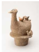
《池田古墳水鳥形埴輪》古墳時代 国指定重要文化財

但馬地域で最も大きな前方後円墳「池田古墳」から出土した水鳥の形をした埴輪がモデルです。池田古墳では全国で最も多い24体もの水鳥形埴輪が見つかっています！