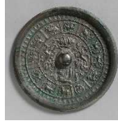
《四神十二支紋鏡》隋（6～7世紀）

兵庫県が誇る古代中国の銅鏡コレクションを持つ「古代鏡展示館」の300点を超える古代鏡がモデルです。