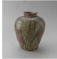
丹波《壺》室町時代後期

日本六古窯のひとつとして有名な丹波焼の壺。表面の模様は、窯で焼いたときに薪の灰が降り注ぎ溶けて流れたあと。実は死者の骨を入れる容器です!?