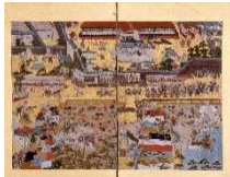
《播磨国総社三ツ山祭礼図屏風》江戸時代 兵庫県指定文化財

いたてひょうぞう 姫路市の射楯 兵主神社で20年ごとに開催されるお祭りの時に作られる大きな3つの造り山（三ツ山）がモデルです。次の開催は令和15(2033)年です。