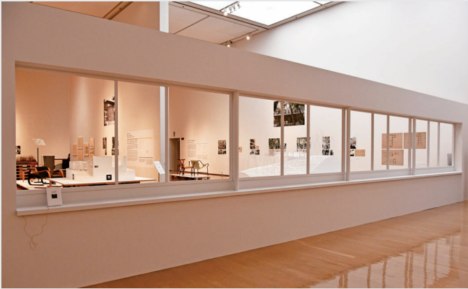
「ヴィラ・ル・ラク」窓辺の原寸大モックアップ