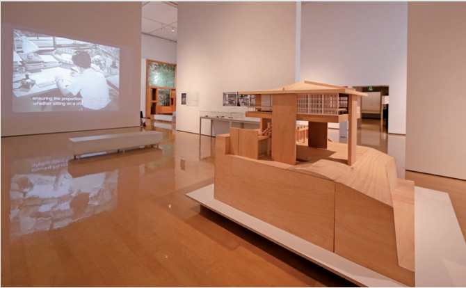
「スカイハウス」模型と映像、奥に「フィッシャー邸」窓辺の原寸大モックアップ

2025年9月20日から2026年1月4日まで、「リビング・モダニティ 住まいの実験 1920s-1970s」展を開催した。20世紀のモダン・ハウスをめぐる建築家の試みを再考するという趣旨のもと、建築家の岸和郎氏の企画・監修により、数年前から国立新美術館（以下、東京会場）で準備が進められ、関西の巡回先として当館が加わることとなった。当館としては2021年に開催した「アイノとアルヴァ 二人のアールト」展以来、4年ぶりの建築展である。以下、展示をめぐる所感を、設営時の奮闘を振り返りつつ記してみたい。