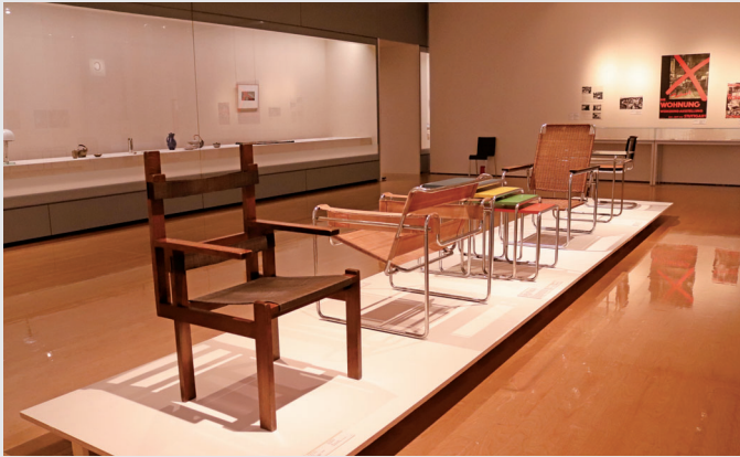
パウハウス関連展示