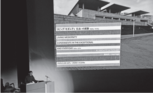
記念講演会の様子