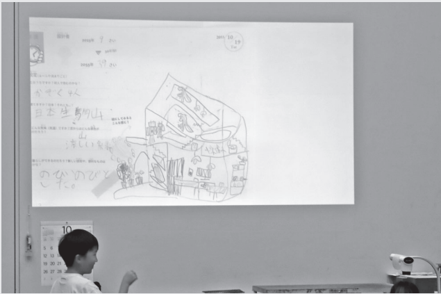
こどものイベント 未来の住まいを発表