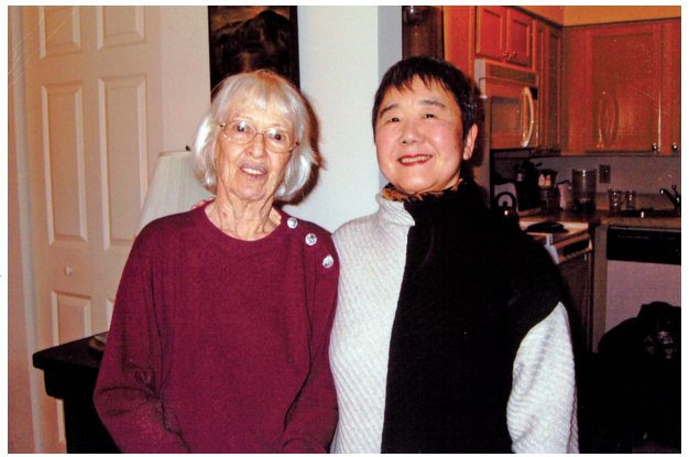
2004年、ニューヨークの自宅のサラ夫人と小澤律子氏