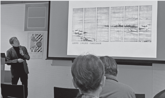
記念講演会の様子

●——編集後記 ●開館以来、特別展を3階、コレクション展を1・2階で開催してきた当館ですが、設備メンテナンスの都合により、約1年間にわたり、展示室の入れ替えを行います（特別展→1階、コレクション展→3・2階）。展示する場所が変わることで、作品の見え方や印象が変わることは、「兵庫のベスト・オブ・ベスト」や本年度の県展（原田の森ギャラリーから当館ギャラリー棟へ移動）でも実感しているところです。