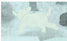
和田淳《私の沼》2017年より ©Atsushi Wada

国内外の映画祭で上演、受賞し、高い評価を得ているアニメーション作家、和田淳(わだ あつし)の個展。ゆるやかなテンポで進行する独創性あふれる映像世界をご紹介します。