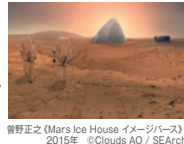
曾野正之《Mars Ice House イメージス》2015年 ©Clouds AO / SEArch