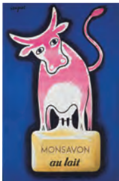
〔牛乳石鹸モンサヴォン〕 1948/50年 パリ市フォルネー図書館蔵

フランスを代表するポスター作家レイモン・サヴィニャックは、鮮やかな色使いと明快な形の中にエスプリを効かせた作風で、多くの人々を魅了しました。本展では、彼の仕事をポスター、原画、写真、書籍など約200点からご紹介いたします。