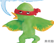
美術館の妖精 イベチャン