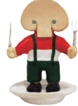
マッシュルーム太郎 (通称：マッシュ)