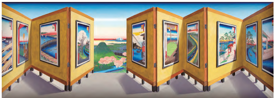
パトリック・ヒューズ 《広重とヒューズ》2013年 作家蔵 ©Patrick Hughes, courtesy Flowers Gallery, London / New York