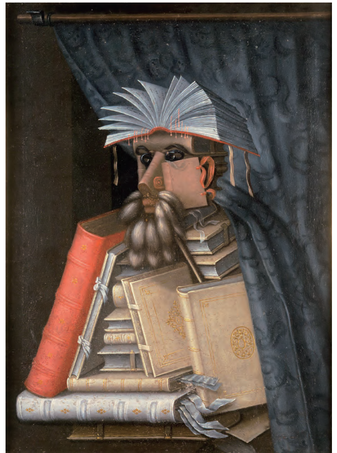
ジュゼッペ・アルチンボルド 《司書》1566年頃 スウェーデン・ストックホルム城(スウェーデン)

人の目をあざむくような美術作品を紹介する「だまし絵Ⅱ」。2009年に開催し、好評を博した「だまし絵」展の第2弾です。今回は、アルチンボルドらの古典的な巨匠を序章で紹介しつつ、より現代的な作品を中心に構成しました。エッシャー、ダリ、マグリットといった20世紀の巨匠をはじめ、リヒター、カプーア、エルリッヒなど現在活躍中のアーティストの作品まで、絵画のみならず、立体や映像も含め、現代の多様なだまし絵的表現を幅広くご覧ください。