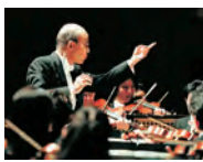
テレマン室内オーケストラ