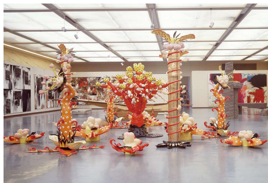
兵庫県立近代美術館「アート・ナウ'87」会場風景 中央：田嶋悦子《Hip Island》(現・岐阜県現代陶芸美術館および作家蔵)

1980年代の熱きアート・シーンを一堂に！ 出品作家約30名による多彩な作品を展示します。