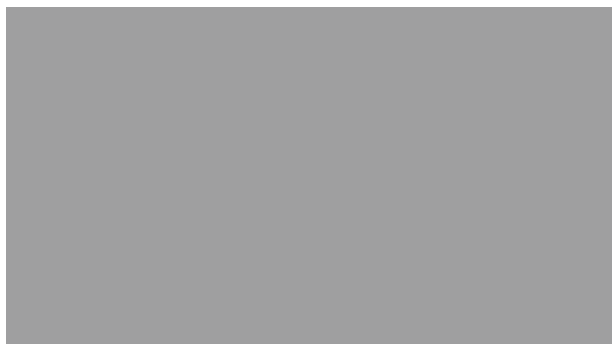
カール・アンドレ《雲と結晶/鉛、身体、悲嘆、歌》1996年 ノルトライン=ヴェストファーレン州立美術館 © Carl Andre / VAGA at ARS, NY / JASPAR, Tokyo 2021 G2719

ミニマル/コンセプチュアル・アートとは？ 1960～70年代の国際的な美術の動向を紹介します。