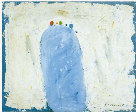
元永定正《寶がある》1954年頃 個人蔵 (三重県立美術館寄託)