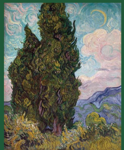
フィンセント・ファン・ゴッホ、《糸杉》1889年6月 油彩・カンヴァス、93.4×74cm、メトロポリタン美術館