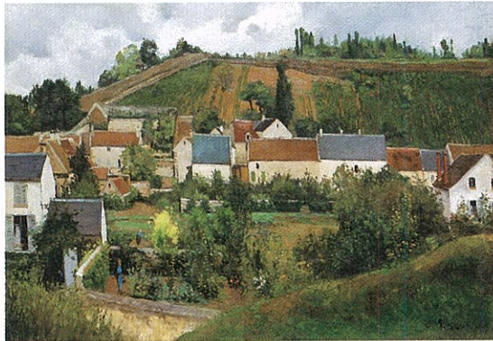
《エルミターージュの眺め、グラット＝コックの丘、ポントワーズ》c.1867 アルブ美術館/ロー・コレクション