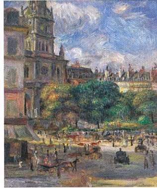
ピエール＝オーギュスト・ルノワール 《トリニテ広場、パリ》1892-93 公益財団法人ひろしま美術館