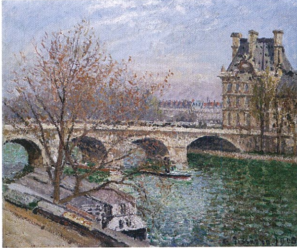
《ロワイヤル橋とフロール館、曇り》1903 ブティノレ美術館