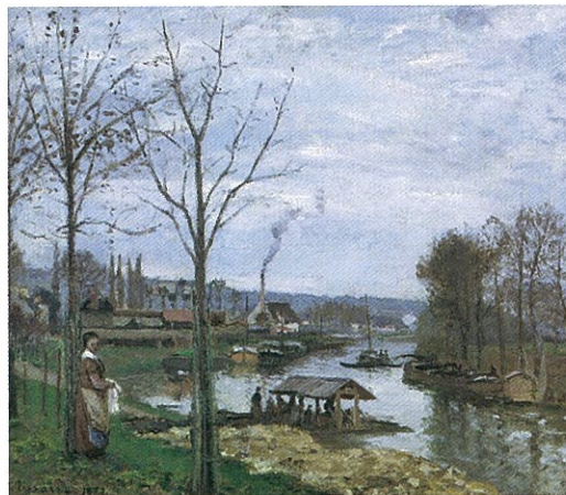
《ボール＝マルリーのセズ河、洗濯場》1872 オルセー美術館 / 第4回印象派展

兵庫県立美術館の開館10周年を記念して開催する本展では、国内外の著名な美術館などが所蔵するピサロ作品約90点に、モネやルノワールらの作品も加え、ピサロの画業を軸に印象派の表現をふりかえります。