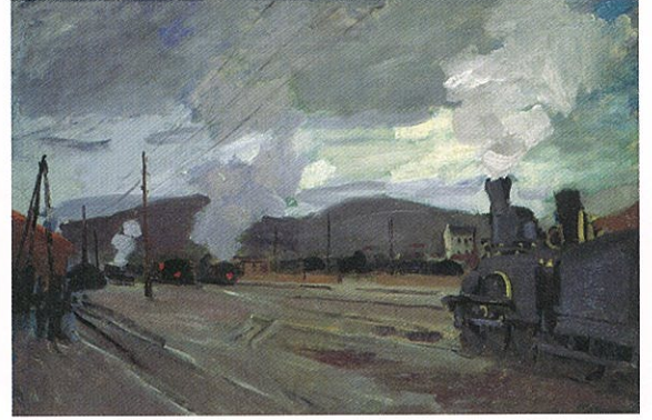
クロード・モネ 《アルジャンツワイユ駅》c.1872 ヴェルドワーズ県議会