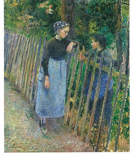
《立ち話》c.1881 国立西洋美術館 松方コレクション / 第7回印象派展