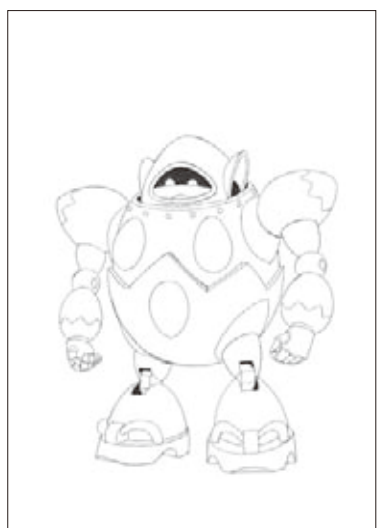
「大鷹の牙ガンダム」基本設定(決定版)「ガンダム」2012 | (部分)