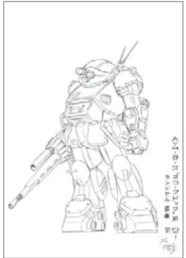
「機動戦士ガンダム」基本設定(決定版)「コア・バスター」1983 | ©サンライズ