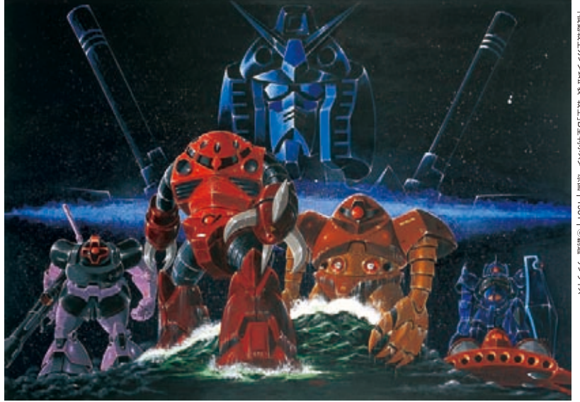
「機動戦士ガンダム」基本設定(決定版)「コア・バスター」1981 | ©創通・サンライズ

〒651-0073 神戸市中央区臨海沿岸1-1-1 (HAT神戸内) http://www.artm.pref.hyogo.jp | tel. 078-262-0901 (代表) | 交通案内 | 阪神岩屋駅(兵庫県立美術館前)から南に徒歩約8分・JR神戸線灘駅南口から南に徒歩約10分・阪急神戸線王子公園駅西口から南西に徒歩約20分・神戸市バス・阪神バス「県立美術館前」下車すぐ・地下駐車場/乗用車80台収容・有料 *ご来館はなるべく電車・バスをご利用ください。 *団体バスでお越しの場合は、バス待機所のご予約をお願いします。