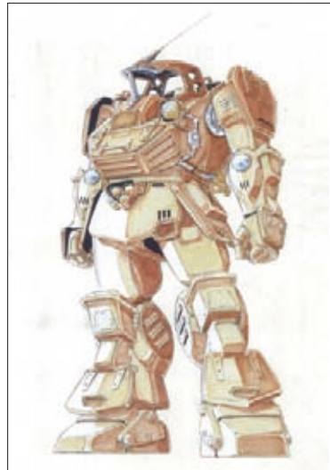
「機動戦士ガンダム」最初期設定「ガンダム」1981頃