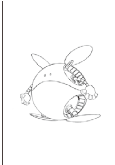
「機動戦士ガンダム」基本設定(決定版)「バコ」1979頃 | (部分) ©創通・サンライズ