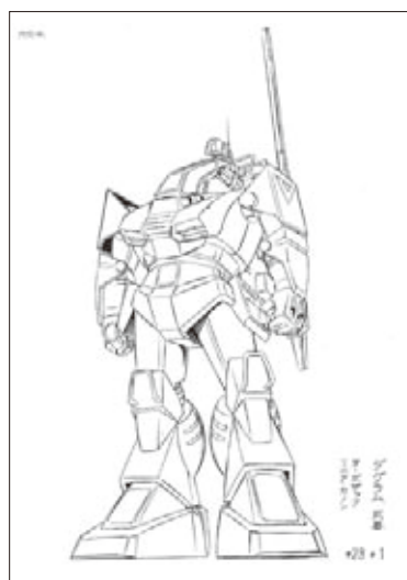
「大鷹の牙ガンダム」基本設定(決定版)「ガンダム」1981頃 | ©サンライズ