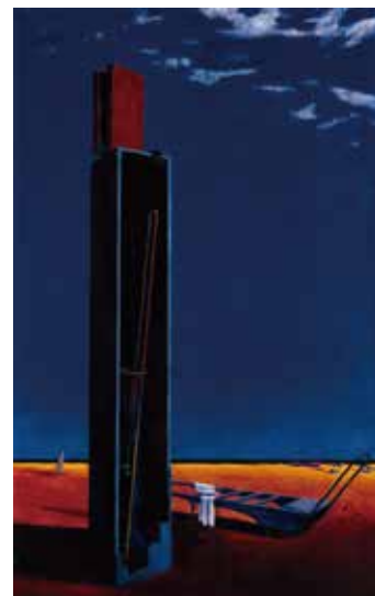
8. 浅原清隆《海を見た》1937年

展示予定作家・点数：橋本関雪、中村不折、安井曾太郎、岸田劉生、吉原治良、他。前期後期合わせて40作家40点。