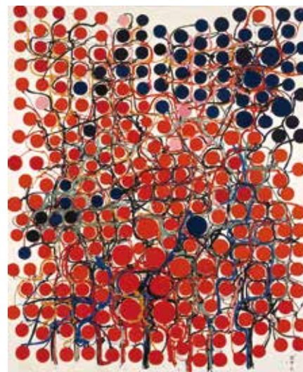
3. 田中敦子《作品》1958年

展示予定作家・点数：李禹煥、田中敦子、植松奎二、アルベルト・ジャコメッティ(前期)、アレクサンダー・アーキペンコ(後期)。5作家18点。