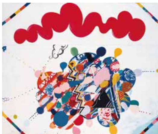
5. 山崎つる子《作品》1963年

展示予定作家・点数：澤田知子、吉村益信、コンスタンティン・ブランクーシ、山崎つる子。4作家8点。