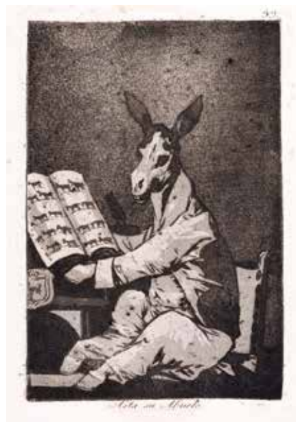
4. フランシスコ・ゴヤ〈ロス・カブリーチョス〉より 《祖父もこうだった》1799年