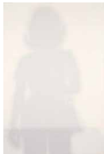
6. 高松次郎《影#394》1974-75年 ©The Estate of Jiro Takamatsu, Courtesy of Yumiko Chiba Associates