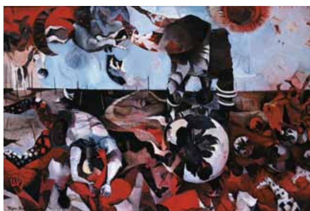
1. 中西 勝《日本アクロバット》1956年 油彩・布