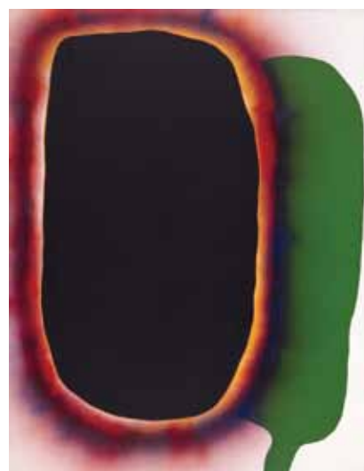
6. 元永定正 《作品 N.Y.No.1》1967年 アクリル・布

横尾忠則は、風景画の空や海を黒く塗ることで、明るい色彩で描いた他の部分との対比を際立たせました。そこにあるはずのパーツがぼっかりと空くだけで、まったく別の世界に迷い込んだかのような不思議な雰囲気になります。斎藤義重による独楽のような立体作品は、形態から生じる軽やかさと黒がもたらす重量感を併せ持っています。他の色を引き立てたり、全体のバランスをまとめたり、または重さを感じさせたり。実はさまざまな役割を果たす黒について考えてみましょう。