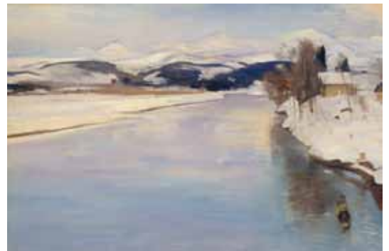
9. 金山平三《大石田の最上川》1948年頃 油彩・布

神戸に生まれた金山平三（1883-1964）は日本各地を旅行して描いた風景画で知られています。旅先に逗留し、自らの描きたい風景を追求して描きました。今回の展示では、代表作《大石田の最上川》など、金山が自然の観察から生み出した美しい色彩表現にご注目ください。