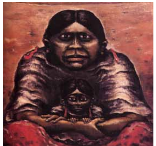
4. 中西勝《大地の聖母子》1971年 油彩・布 東京国立近代美術館蔵