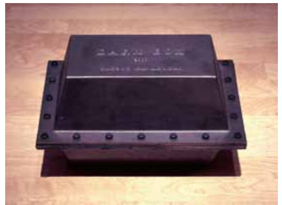
7. 河口龍夫《DARK BOX 2007》2007年 鉄、闇

福岡道雄は、縦 2.3m、横 3.2m の強化プラスチックの表面に、「何もすることがない」という言葉をくりかえし刻みました。小さな文字が無数に広がる壁のような作品を前にすると、まるで、言葉の波に圧倒されるようです。また河口龍夫の《DARK BOX 2007》は、暗闇を閉じ込めた鉄の箱です。目には見えないけれど、鉄の板の向こうには確実にあるはずの闇の世界。私たちに、それが「ある」と想像することしかできません。これもまた黒の素材のひとつと言えるでしょう。技法や材質によって全く異なって現れる黒色の違いを楽しんでみてください。