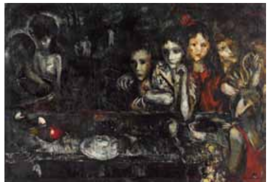
3. 中西勝《無題》1949年 油彩・布

一方、初期の代表作《日本アクロバット》（1956年、兵庫県立美術館蔵）に見られる、社会とそこに生きる人々への鋭い眼差しも重要で、1965（昭和 40）年から 1970（昭和 45）年にかけての世界旅行での見聞を描いた《大地の聖母子》（1971 年、第 15 回安井賞受賞作、東京国立近代美術館蔵）や《棲まう（ソピロテ）》（1978 年）など、60 余年の画歴の頂点をなす作品の基盤となっています。