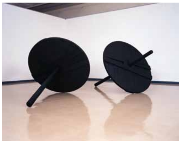
2. 斎藤義重《複合体102-1・2》1984年 ラッカー、木、ボルト