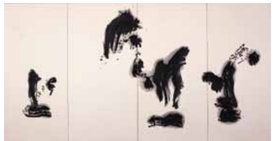
8. 森田子龍《坐組上》1969年 墨・紙（前期展示予定）

アルベルト・ジャコメッティによる一連のデッサンでは、彼が過ごしたパリの日常風景が素早く的確な線で写し取られており、当時の空気がよく伝わってきます。吉川霊華は、細く優美な線によって、人物の表情や衣装の髪を巧みに描きだしました。細かな線を追っていくと、それがいかに熟練した唯一の線だったかが分かります。太かったり細かったり、真っ直ぐだったりぐねぐねしていたりと、くるくると表情を変える黒い線。線そのものを辿り、また線それだけで紡ぎ出されるイメージの豊かさに触れてみましょう。