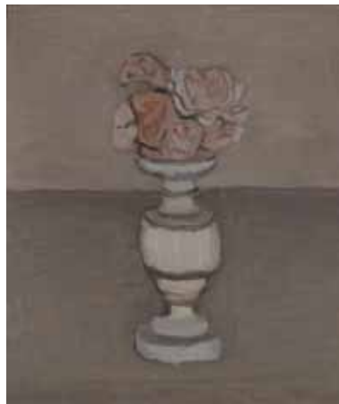
4. 《花》1950年 モランディ美術館（ボローニャ）蔵