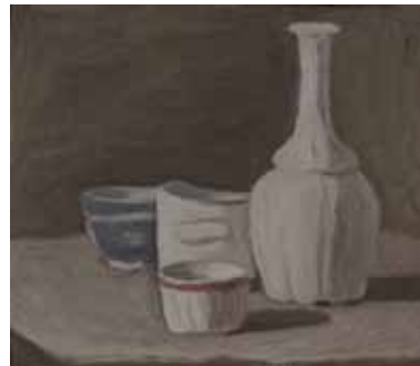
2. 《静物》1946年 モランディ美術館（ボローニャ）蔵

1890年ボローニャに生まれ、生涯を通じ同地と近郊のグリッツアーナに暮らす（初めてイタリアを離れたのは、晩年の1956年だった）。ボローニャの美術アカデミーに学ぶ。1914年にボローニャで開かれた一夜限りの未来派展に参加、1918年にはジョルジョ・デ・キリコやカルロ・カッラの作品を知り、形而上絵画を描く。しかしモランディの前衛美術への接近はごく限定的なもので、1920年代以降は特定の流派に属さず、静物や風景など限られたモチーフを繰り返し描き、静謐で瞑想的な絵画世界を確立した。