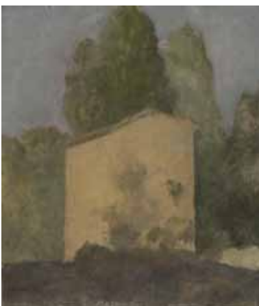
5. 《風景》1921年 モランディ美術館（ボローニャ）蔵