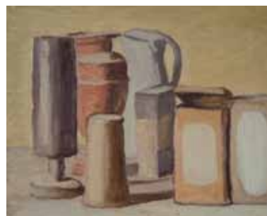
3. 《静物》1949年 モランディ美術館（ボローニャ）蔵