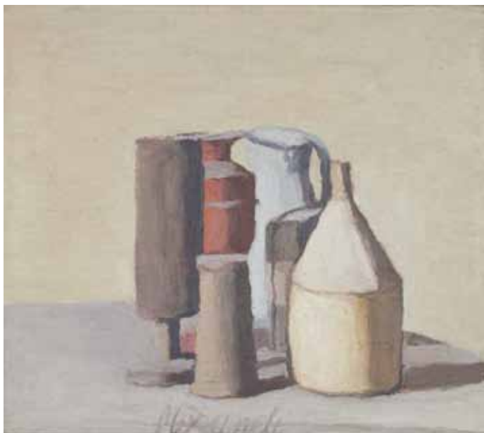
1. 《静物》1948年 モランディ美術館（ポローニャ）蔵