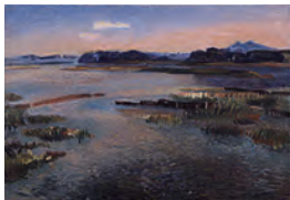
池田栄治《国土畫》1942年

本展は、1940年から50年までの間に制作された美術を展覧します。1940年代は、前半がアジア・太平洋戦争の時代、後半が連合国軍によって占領された時代です。このような激動の時代を大きく反映した作品もあれば、時代から一定の距離を取った作品もあります。様々な美術家の活動を、洋画を中心に、素描、日本画、彫刻も加えて紹介します。