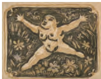
谷中安規《少年礼賛》1937～39年頃 M氏コレクション

激動の昭和初期、独自の幻想的ビジョンを木版に刻み続けた鬼才・谷中安規(1897-1946)。長年、その研究と収集に情熱を燃やし続けたM氏による珠玉のコレクションを、蔵出し初公開。当館と京都国立近代美術館の収蔵品を加えた約170点を一堂に展示中です。