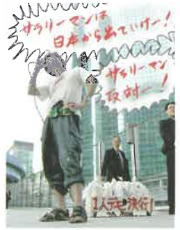
会田誠《一人デモマシン(サラリーマン反対)》2005年