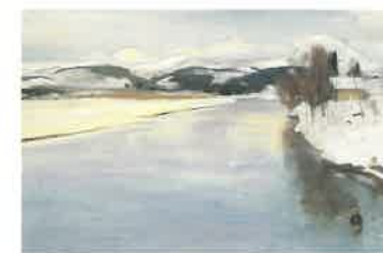
金山平三《大石田の最上川》1948年頃