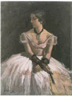
小磯良平《雨りの前》1934年 京都市美術館蔵