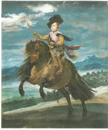
ディエゴ・ベラスケス《王太子レタサル・カルロス騎馬像》1635年頃 マドリード、プラド美術館蔵

歴代スペイン国王の収集品を核として1819年に開設されたプラド美術館。本展は同館が誇る巨匠ディエゴ・ベラスケスの本邦初公開の作品を含む7点を軸とし、ティツィアーノやルーベンスなど王室コレクションの数々の傑作で構成します。絵画の黄金時代といわれる17世紀を中心とするヨーロッパ絵画の粋をご覧いただく貴重な機会となります。