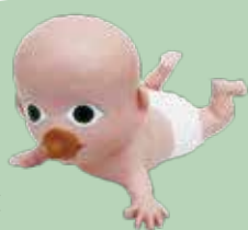
びじゅつかん ようかい 美術館の妖怪 バブーあかご