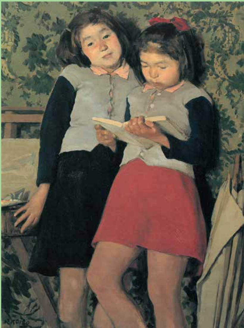
小磯良平 《二人の少女》 1946年 神戸市立小磯記念美術館蔵

とくべつてん こいそりょうへい よしはらじろう てんかんれん 特別展「小磯良平と吉原治良」展関連