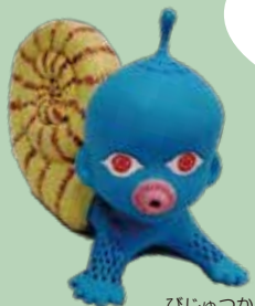
びじゅつかん ようかい 美術館の妖怪 バブーみどりご