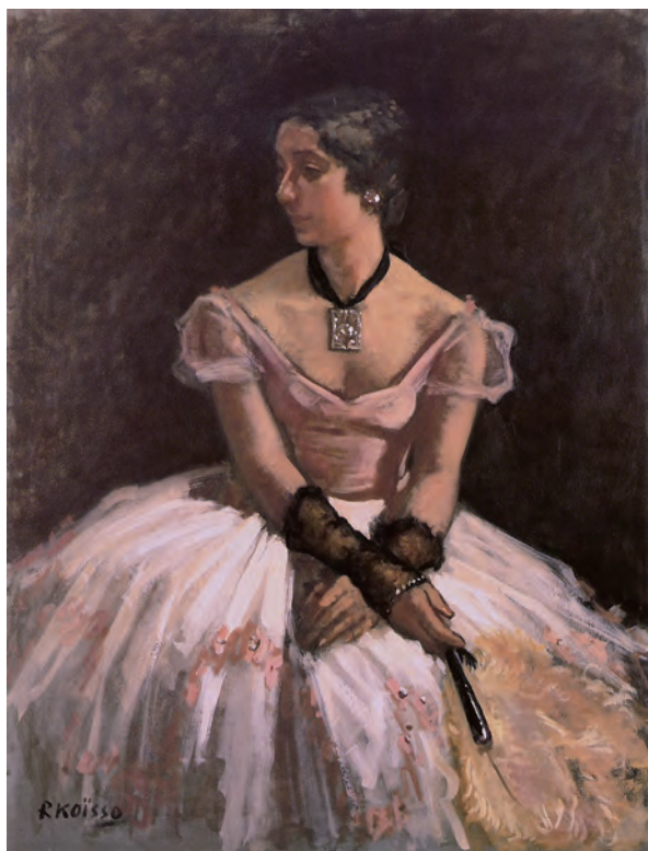
小磯良平《踊りの前》1934年 油彩・布 京都市美術館蔵

阪神間が生んだふたりの巨匠、小磯良平（1903ー1988）と吉原治良（1905ー1972）。彼らはほぼ同時代に地理的にきわめて近い位置において制作してきたにもかかわらず、その画業を同時に評価する機会は従来ほとんどありませんでした。本展では彼らの作品を時代ごとに並置し、それぞれの画業の再確認とともに、その対照性と類似性を明らかにします。