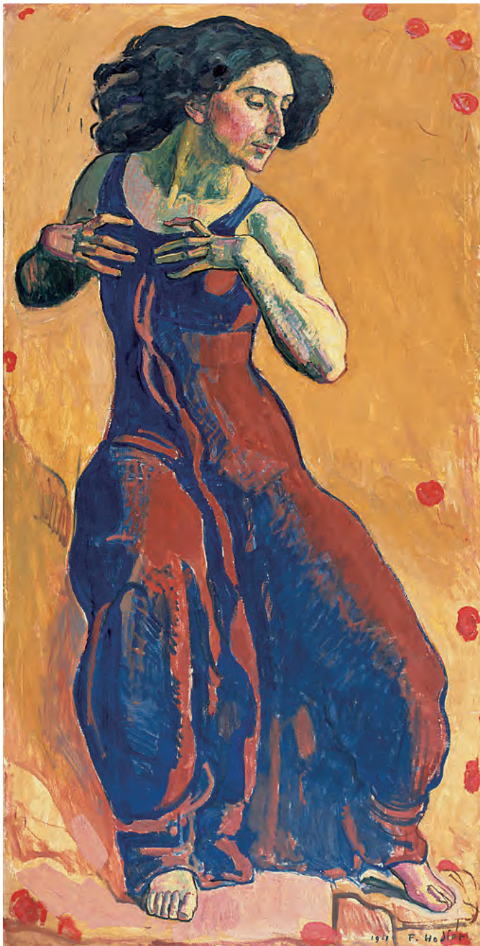
《恍惚とした女》1911年 ジュネーブ美術・歴史博物館

フェルディナント・ホドラーは、19世紀末から20世紀初頭にかけてのスイスの象徴主義を代表する画家で、母国では今日でも「国民画家」として親しまれています。その力強い線描、大胆な賦彩、リズムカルな構図は、大型の油彩画やフレスコ壁画など、とりわけ装飾的な大画面に効果を発揮しています。一方、身近なアルプスの自然も、この画家の想像力の源泉でありつづけました。日本で40年ぶりに開催される本展は、日本初公開となる大作が出品される過去最大規模の回顧展となります。