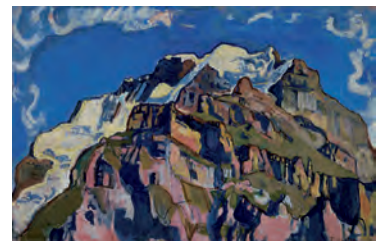
《ミュレンから見たユングフラウ山》1911年 ベルン美術館 Depositum der Gottfried Keller-Stiftung/Kunstmuseum Bern