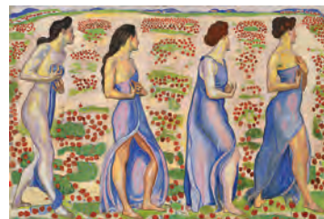
《感情Ⅲ》1905年 ベルン州美術コレクション