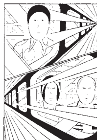
『トラベル』より(2002-05年) Courtesy: East Press ©Yuichi Yokoyama

視覚に障がいのある方にも美術館に来ていただきたいという思いから始まった「作品に触ることのできる」当館の恒例企画です。今回は独自の「ネオ漫画」が注目を集める横山裕一(1967-)氏を迎え、当館コレクションとのコラボレーションをお楽しみいただけます。