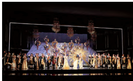
宝塚大劇場星組公演『眠らない男・ナポレオン—愛と栄光の暈に—』 ファイナーレ 2014 年

国民的エンターテインメントとして、人々に夢と感動をあたえ続けている宝塚歌劇100周年を記念して開催します。1914(大正3)年4月1日の初公演以来、創設者の小林一三(1873-1957)が提唱した「新しい国民劇の創成」という理念のもと、様々な困難を乗り越え、多くのスターを生み出し、常に新たな可能性に挑み進化し続ける宝塚歌劇の世界を紹介します。