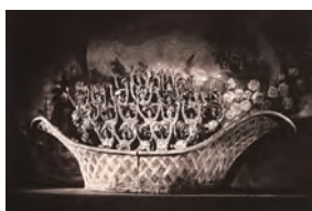
『パリエット』1930年 月組

国民的エンターテインメントとして、人々に夢と感動をあたえ続けている宝塚歌劇100周年を記念して開催します。1914(大正3)年4月1日の初公演以来、創設者の小林一三(1873-1957)が提唱した「新しい国民劇の創成」という理念のもと、様々な困難を乗り越え、多くのスターを生み出し、常に新たな可能性に挑み進化し続ける宝塚歌劇の世界を紹介します。