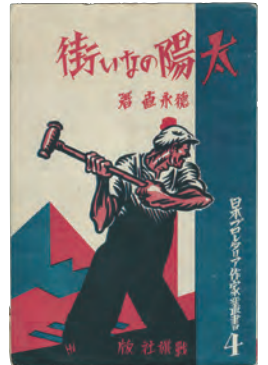
徳永直『太陽のない街』 装幀：柳瀬正夢 1929年 世田谷文芸館

観覧料 一般1,200(1,000)円、大学生900(700)円、高校生・65歳以上600(500)円、中学生以下無料 *（ ）内は前売料金及び20名様以上の団体割引料金（高校生・65歳以上は前売なし） *障害のある方とその介護の方1名は各当日料金の半額（65歳以上除く） *神戸ビエンナーレ2013の会期中、ビエンナーレ入場券（半券可）ご提示により、本特別展を団体割引料金でご覧いただけます。