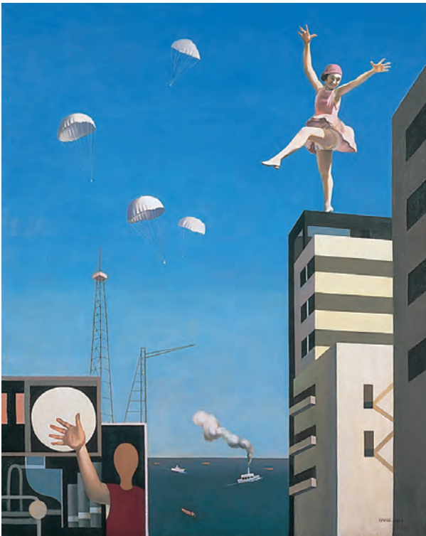
古賀春江『窓外の化粧』1930年 神奈川県立近代美術館

昭和期の最初の10年間は、文化的に多産で豊かな時期でした。この展覧会では、日本が次第に戦争へと向かうこの時期の絵画と文学に焦点を絞り、なかでも特徴的な表現を示した洋画と小説に注目します。どちらにも共通する3つの大きな潮流を代表的な作品によって紹介し、時代の精神や雰囲気を立て体的にご覧いただけます。戦前期の文化の活力と豊かさ、その魅力をぜひお楽しみ下さい。