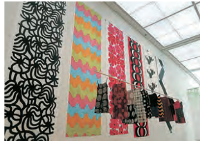
展示風景(兵庫県立美術館)