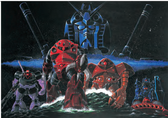
「機動戦士ガンダムII 哀・戦士編」B全判ポスター原画 1981 ©創通・サンライズ