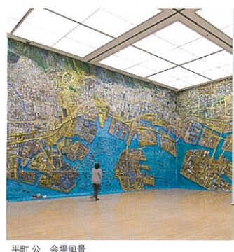
平町 公 会場風景