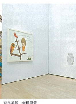
奈良美智 会場風景