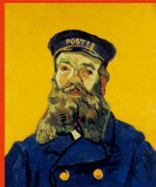
フィンセント・ファン・ゴッホ 《郵便配達人 ジョゼフ・ルーラン》1888年