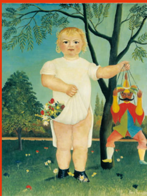
アンリ・リッソー(赤ん坊のお祝い!) 1903年