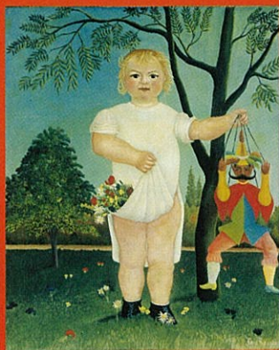
アンリ・ルソー 《赤ん坊のお祝い》1903年