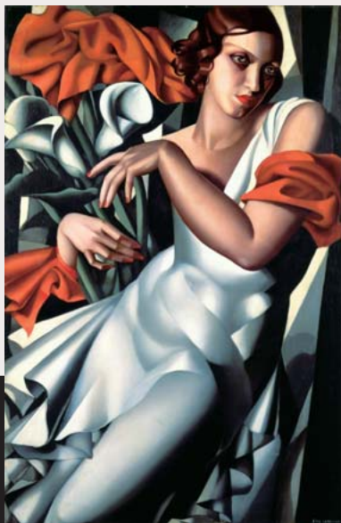
《イーラ・Pの肖像》 1930年/油彩・板/個人蔵