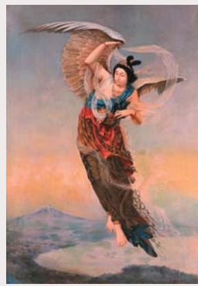
本多錦吉郎《羽衣天女》1890年 兵庫県立美術館

日本最初の公立近代美術館・神奈川県立近代美術館は戦後まもない1951年、鎌倉の鶴岡八幡宮境内に開館しました。当時の日本に美術館運営の経験はゼロ、手探り状態からのスタートでした。そして約20年後の1970年、2番目の公立近代美術館・兵庫県立近代美術館が誕生（2002年より兵庫県立美術館）。地域に密着した個性的な活動を展開してきました。このたび、両館の代表作品が共演します。31日間限定のかつてない「近代美術館」で、一体どんな化学反応が起きるのでしょうか!? 会場でお待ちしています（当館だけの開催です）。