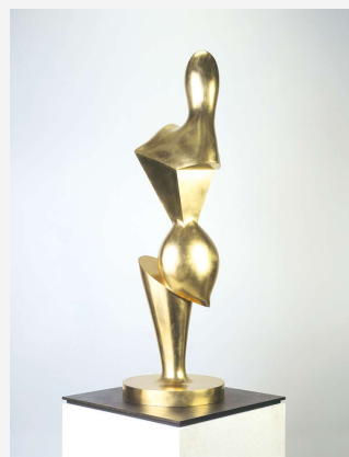
ジャン・アルプ《陽気なトルン》1965年 昭和57年度財団法人伊藤文化財団寄贈