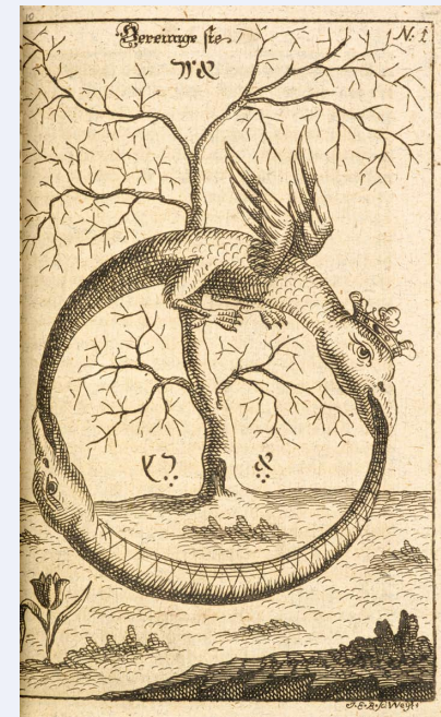
ラビ・アブラハム・エリヤツァール「太古の化学作業」1735年 大英図書館蔵 © British Library Board