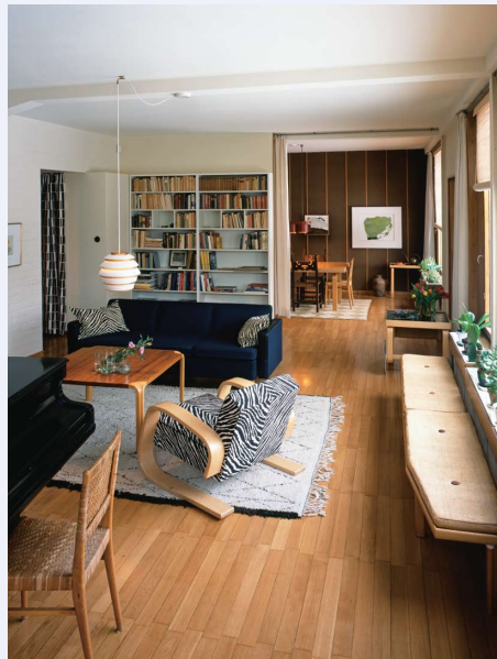
アアルト自邸 リビングルーム、2003年 Alvar Aalto Foundation Photo: Majja Holma

白川裕信氏(ギャラリー エークワッド館長) 岡部三知代氏(ギャラリー エークワッド副館長) 7月11日(日) 14:00～(約90分) ミュージアムホール 定員125名、聴講無料、要観覧券、当日先着順